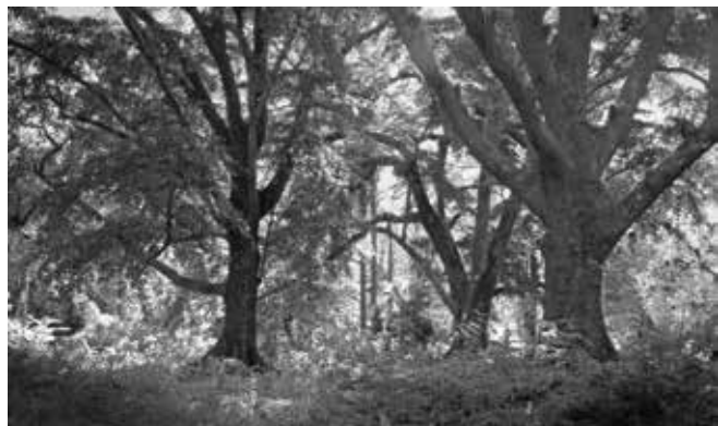
Ana Torfs, The Parrot & the Nightingale, a Phantasmagoria , 2014, detail

Porin taidemuseon Suomi 100 -juhlavuoden päänäyttely tuo taidemuseon kokoelmat suureen näyttelytilaan Halliin. Poikkeuksellinen, taidemuseoinstituutiota uudella tavalla tarkasteleva näyttely Muistin ajankohtaisuus – Rinnakkaiset todellisuudet tarjoaa yleisölle mahdollisuuden nähdä taidemuseotyön ytimeen, kokoelmien ja arkistojen hoitoon. Esille nostetaan sellaisia näkökulmia ja kysymyksiä, jotka tavanomaisesti avautuvat vain museoammattilaisille. Samalla avautuu moniulotteinen kuva jatkuvassa muutoksessa olevan taiteen eri ilmiöihin, tulkintojen ja uudelleentulkintojen historiaan eri vuosikymmenillä.