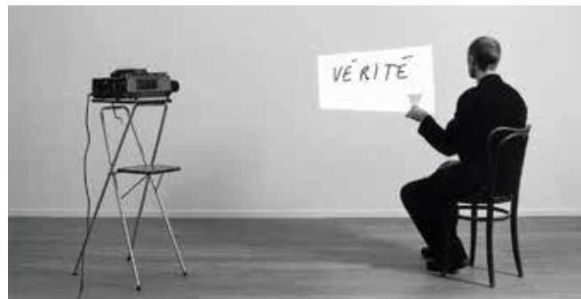
Ana Torfs: Toast (2003)

Memory and its processes have in recent years become increasing prominent in the exploration of the preconditions of human creativity and problem solving. OPEN STORAGE – Remembering for the Future is the main exhibition at the Pori Art Museum during the centenary of Finnish independence, Finland 100 . The exhibition highlights the past and the present as both sources and facilitators of the future. Investigating art and the art museum as an institution in surprising and novel ways, the exhibition features a display of the museum collections in its main gallery, Hall. Eschewing conventional exhibition concepts, the show instead presents a layered whole that consists of processes and which gives the public a glimpse into the core of museum work: the management of collections and archives. It also highlights the complexities of the constant flux of phenomena in art and the history of interpretation and reinterpretation over the decades.