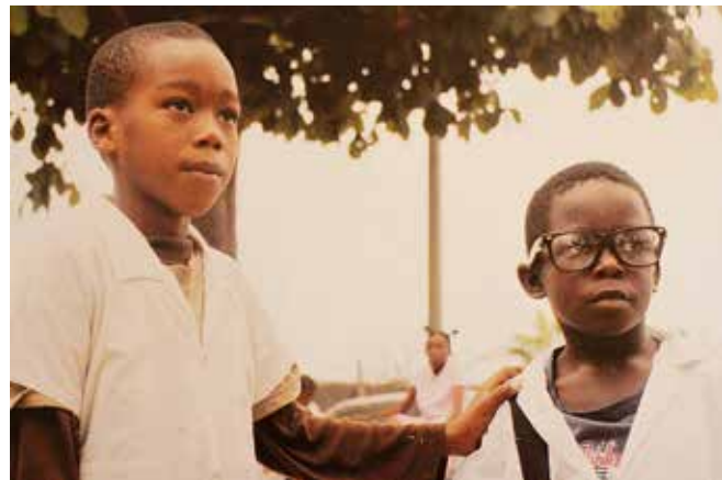
Binelde Hyrcan: Cambeck, (2010) , videoteos

Binelde Hyrcan (s. 1983) on syntynyt Luandassa, Angolassa ja hän elää ja työskentelee Angolassa ja Ranskassa. Cambeck-lyhytelokuvassa nähdään ryhmä poikia leikkimässä hiekkarannalle kaivatussa ”limusiinissa”. Yksi heistä on kuski ja takapenkillä istuvat isot kihot kilpailemassa siitä, kenellä heistä on edessään hienoin tulevaisuus. ”Minä muutan Amerikkaan, asun siellä oikeassa rakennuksessa, te jäätte tänne ja asutte oluttölkeistä kyhättyssä talossa!”