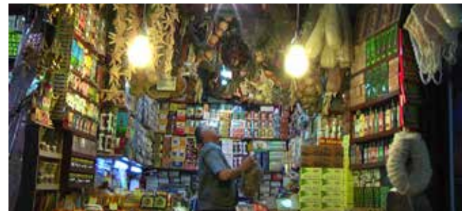
Nisrine Boukhari: ”The Day Before...” , Filmed in 2010 - produced in 2012, video installation

texts or historical documents often constitute the starting point of her works. These material remnants are then reworked into meticulously composed installations—with diverse media such as slide projections, sound, photography and video, to tapestries and silk screens—in which projections and allusions have free reign.