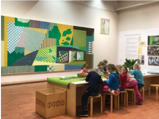
PEDApiste. Yleisöjen työskentelypiste näyttelyiden ytimessä.

Tiedustelut & varaukset: mirja.ramstedt-salonen@pori.fi / 044 701 1119